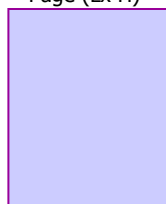
Page (L x H)

Adresse de livraison Initial Régie / Styles de vie Sandrine Lenoir 6 rue Daru 75008 PARIS Tel : 01 44 15 32 09