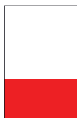
1/2 page largeur