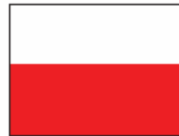
Double 1/2 page - Bandeau