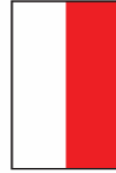
1/2 page hauteur