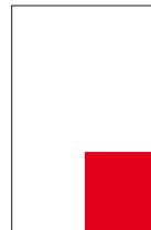
1/4 page carré