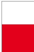
1/2 page largeur