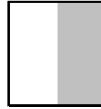
1/2 page hauteur