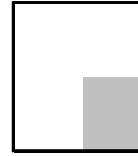
1/4 page carré