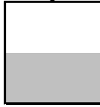
1/2 page largeur